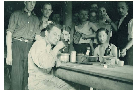
Dwangarbeiders aan tafel in hun barak.

Maar Hannover was herbouwd. „De stad is weer net zo mooi als vroeger.”